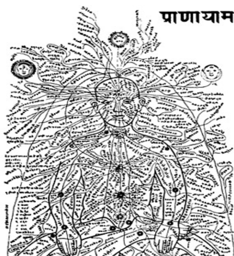
Fig. 2. Rețeaua nadi-surilor